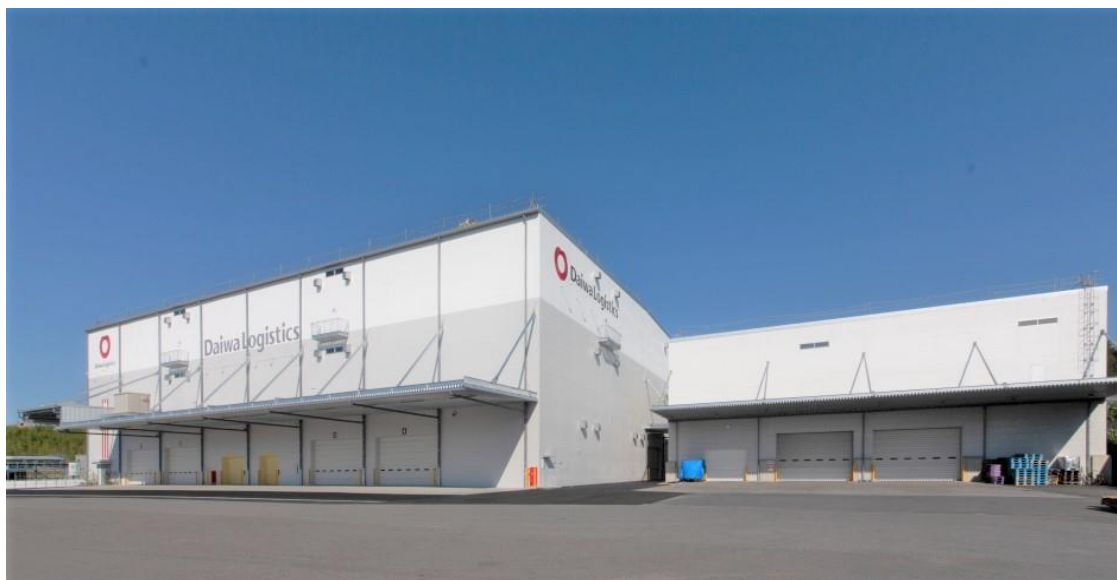
【滋賀物流センター（左）と増築棟（右）】