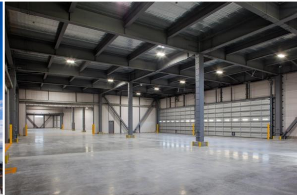
【海老名物流センター】

海老名物流センターは、「改正物流総合効率化法」に認定された特定流通業務施設で、南関東エリアにおける建築・建材の物流センターとなります。