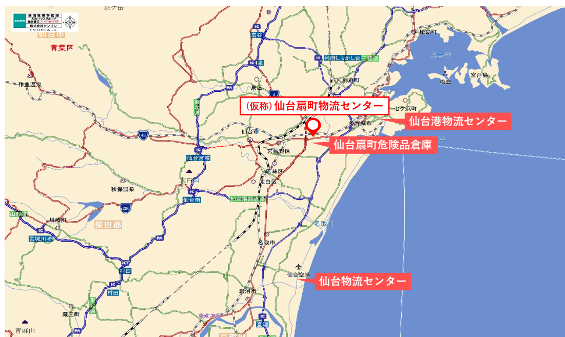
【仙台エリアにおける物流拠点開発状況】

当社は仙台エリアにおいて、これまでに物流施設3拠点を開設するなど、事業基盤の強化に取り組んできました。今後も、エリア内のネットワークを活用し、車両や作業員を連携することで、多様化する物流ニーズに対して柔軟に対応し、物流サービスレベルのさらなる向上を図っていきます。