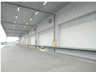
【庇下の荷役スペース】

さらに、倉庫及び事務所の全館で LED 照明を採用し、屋上には太陽光パネル(約 500kW)を敷設するなど、環境にも配慮した施設です。