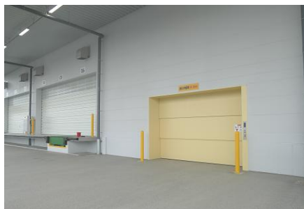
【貨物用エレベータ】